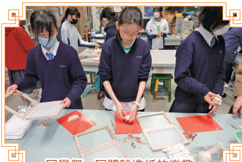
同學們一同體驗造紙的樂趣。