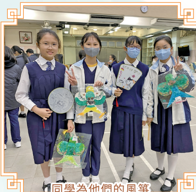
同學為他們的風箏 繪上精美的圖案。