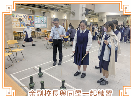
余副校長與同學一起練習投壺的技術。