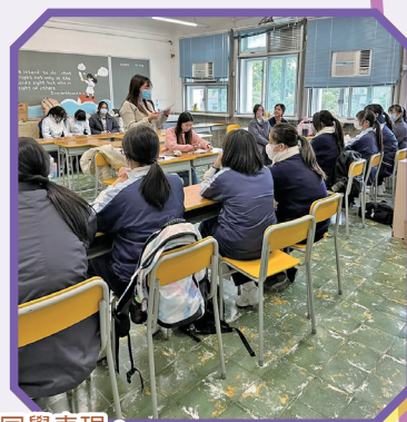
老師點評同學表現。