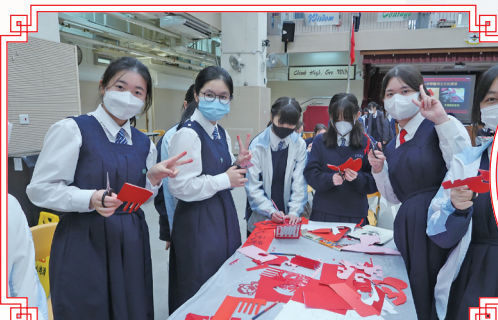
同學展現其精湛的剪紙技術。

揮春、剪紙是同學每年都期待的活動，這些看似簡單的手作，背後卻蘊藏着中華文化的底蘊。揮春作為中華文化的瑰寶，其獨特的藝術風格，寓意深遠的文字和書法形式，是中華文明的重要組成部分。每逢新春我們都會寫揮春、剪紙以迎接新年的到來，希望藉此表達自己及對他人的祝福。當天，同學樂在其中，享受濃烈的新春氣氛。