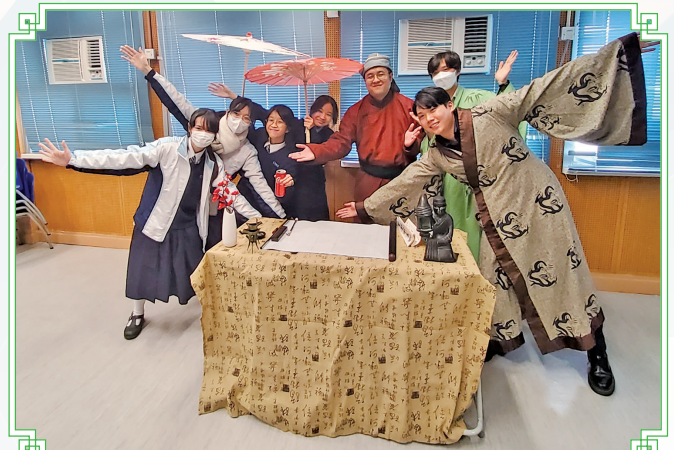
同學們在書齋場景與「德雅才子」們打卡。