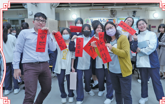
同學把自己的願望都寫在揮春上。