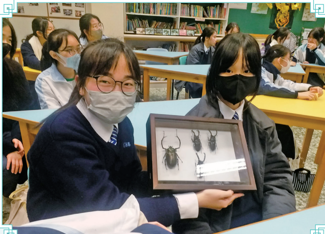
同學正在欣賞「陽彩臂金龜」的標本。

所謂「讀萬卷書不如行萬里路」，此次活動讓同學有機會走出課室，親身到花墟公園參與尋蟲考察，了解中國生態發展，更有機會一覽國家二級保護動物「陽彩臂金龜」的標本。是次活動極具學習意義，因而受到同學們的熱烈支持。不少參與活動的同學表示，活動內容生動有趣，更讓同學親近大自然，放鬆心情，減緩學業的壓力。