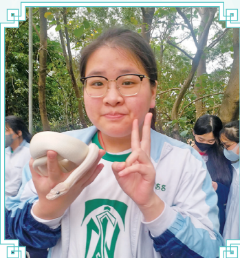
同學找到白蛇標本。