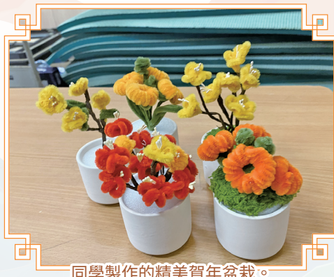
同學製作的精美賀年盆栽。