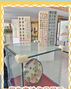
學生書法作品展示