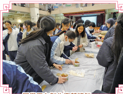
同學正在製作麥芽糖餅。

傳統小吃糖不甩和麥芽糖餅深受同學喜愛。同學在老師的指導下用心製作食品。透過此次活動，同學不僅能藉此機會學習製作傳統食物的方法，更有幸一嚐聞名於中國大街小巷的傳統美食。