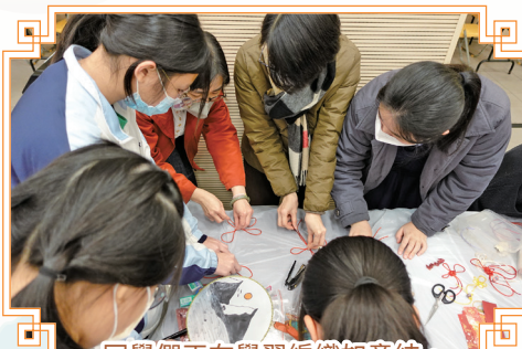
同學們正在學習編織如意結。

當天的傳統技藝工作坊，包括造紙、畫扇、造風箏、製作新春小盆栽、摺龍、編織如意結等，其中造紙技術，每一步都十分講究，只要稍有偏差都會導致失敗，又如編織如意結需要不斷在失敗中學習，才能領悟其中竅門。同學沉浸其中，極為專注，完全被中華文化深深地吸引著，這正是華夏文化的魅力所在。