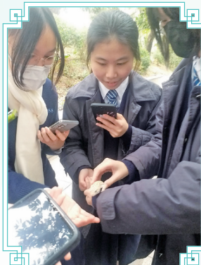
同學成功尋獲「蟲蟲」。