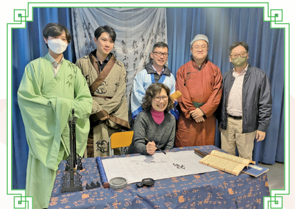
老師都頗為享受華服日的換裝體驗。