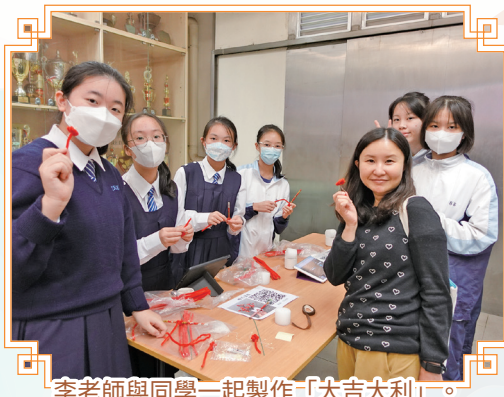
李老師與同學一起製作「大吉大利」。