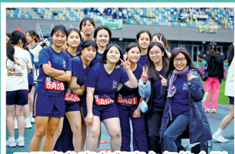
五甲班參賽者與班主任的合影