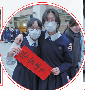
祝願德雅的學生學業進步！