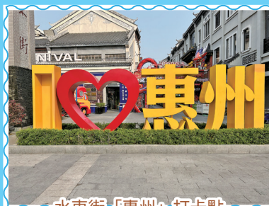
水東街「惠州」打卡點