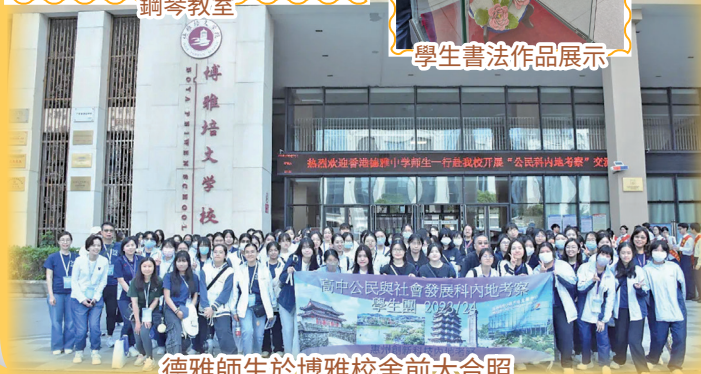
德雅師生於博雅校舍前大合照

其次，博雅培文學校作為內地一所優秀的高校，在升學方面不僅提供通過普通高考升學的課程，更設立了「國際部」，為同學設立海外升學的課程和提供相關資訊。可見學校致力讓同學面向多元化的文化交流，讓他們的发展不再止步於國內發展的機會，更有邁向國際平台的願景。