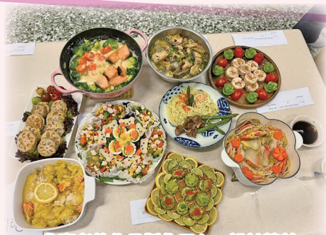
參賽者的作品製作用心，設計精美。

透過是次比賽，參賽者藉此提升廚藝，還能與促進家人之間的感情，更能培養同學對健康飲食的習慣。