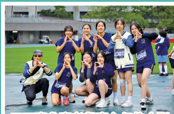
五丁班參賽者與班主任的合影