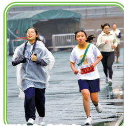
同學冒雨前進，堅持完成賽事。