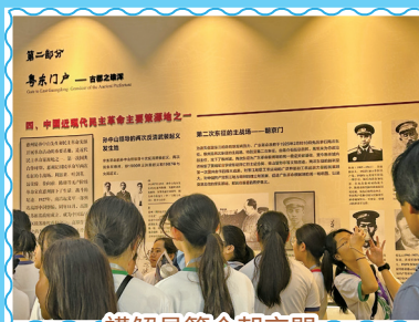
講解員簡介朝京門