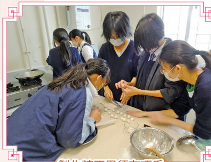
製作糖不甩須有巧手。